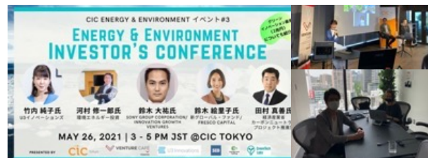
環境分野の投資家とスタートアップのメンタリング