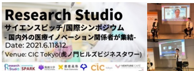
大学研究者によるピッチとシンポジウム

CICがこれまでに実施した100件のイベントのほとんどが100名以上が参加するピッチ、マッチング、メンタリングであり、大学関係者とのイベント共催実績も豊富