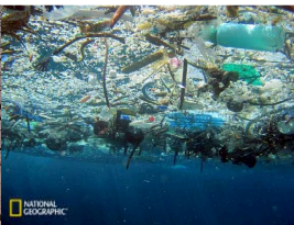
プラスチックごみ