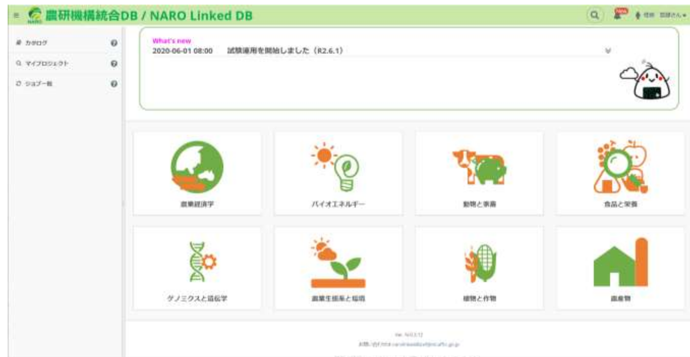
農研機構統合DBのトップ画面