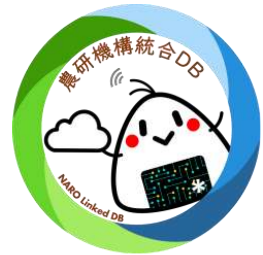
農研機構ダイバーシティ推進キャラクター 「©おむすびなろりん」農研機構統合DBバージョン